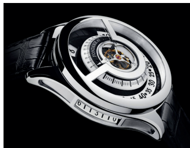
Garde-temps réalisé pour un riche Américain. «Pour le mouvement et la boîte, nous sommes parti d'une feuille blanche, tout est nouveau»