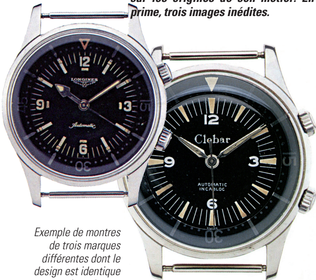
Exemple de montres de trois marques différentes dont le design est identique à part le cadran et les aiguilles: modèles Longines, Milber et Clebar, années 60.

Dans le cadre d'un travail de recherche qu'il effectue, en mars 2013, pour l'ECAL, haute école d'art et de design à Lausanne, le fondateur de l'Atelier XJC, à La Chaux-de-Fonds, se penche sur les origines de son métier. En prime, trois images inédites.